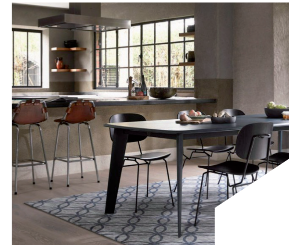
Het nieuwe grafische cirkelpatroon uit de tapijtcollectie Desso&Ex

We zijn ons steeds meer bewust van de directe leefomgeving om ons heen. Hoe kunnen we onze leefomgeving zo efficiënt en duurzaam mogelijk inrichten? Conscious living is nu helemaal aan de hand. Deze bewustwording kruipt dieper in de details en interieuraccessoires van onze lifestyle. Kijk bijvoorbeeld naar de Rainbow collectie van het Deense designlabel HAY, gemaakt van duurzaam porselein met een licht doorschijnend, gekleurde laklaag. Of de duurzame Sense of Luxury-collectie van Brabantia, waar nu zes luxe kleuren aan zijn toegevoegd. De pedaallemmers zijn