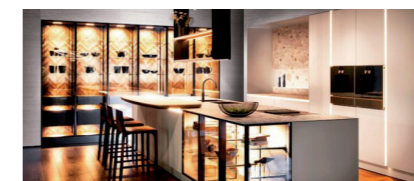
Het nieuwe greeploze keukendesign van SieMatic

Toch toe aan een extra accent in huis? Desso ontwikkelde samen met interieurarchitect Odette Ex de unieke collectie Desso&Ex die nu in vijf trendy kleurstellingen beschikbaar is. Zoals het nieuwe grafische cirkelpatroon hier op de foto. Een absolute aanrader voor extra diepte.