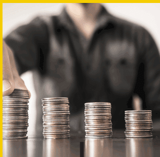
Leven en inkomen