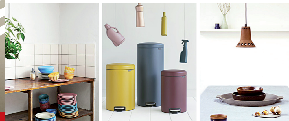
Foto: links Rainbow plates van Hay | midden prullenbak Sense of Luxury van Brabantia | rechts: hanglamp Terracotta van Hkliving

Siematic lanceert een nieuw en innovatief keukenontwerp: "het nieuwe greeploze design van SieMatic". In dit nieuwe design staat een nieuwe manier van denken centraal. Hoe kan de buitenkant er zo strak en gestroomlijnd mogelijk uitzien zonder in te leveren op comfort? Het ontwerpteam van SieMatic komt met een volledig herontwikkeld keukendesign waarbij de buitenkant er zo puur en eenvoudig mogelijk uitziet. Achter de keukenkasten en -lades schuilt een knap en complex staaltje ambachtelijk design. Door de perfecte hoek, de ideale touch en een LED-verlichtingssysteem met individueel regelbare lichtpunten heeft u gegarandeerd een luxe en exclusieve keuken.